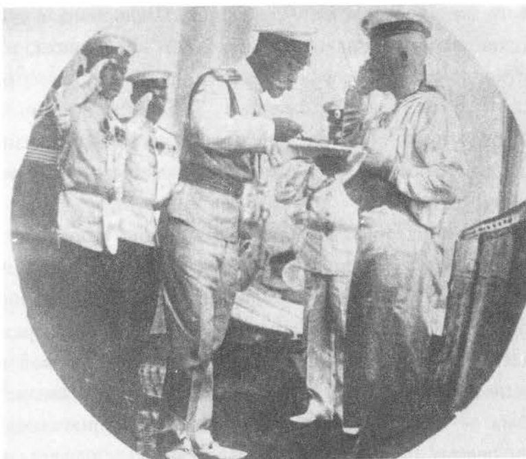
Николай II снимает пробу с матросской пищи