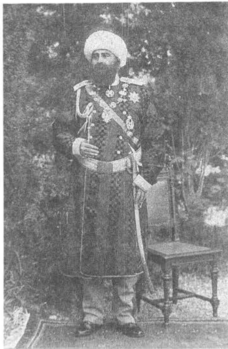
Его высочество эмир Бухарский генерал-адъютант Сеид-Абдул-Ахан-хан (Ялта, 17.10.1908г.)