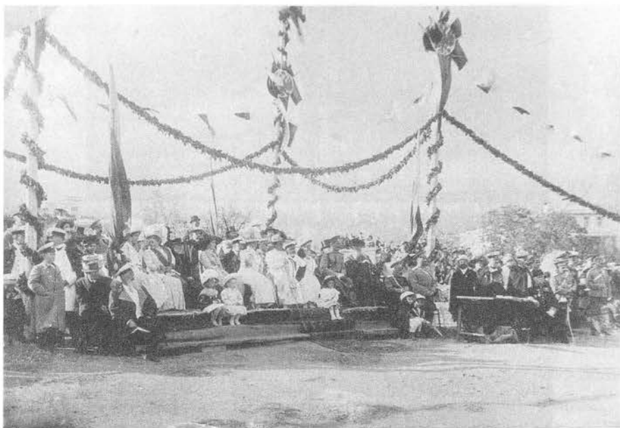
Ялтинский “бомонд” на Набережной улице

Корпус “Штандарта” вольнонаемными малярами и матросами-специалистами был выкрашен до ватерлинии черной голландской сажей на олифе и покрыт каретным лаком высшего качества. Деревянные украшения и канаты были покрыты шеллаком и сусальным золотом. Однажды их позолотили монашки Новодевичьего монастыря в Санкт-Петербурге, славившиеся как отличные позолотчицы. Позолоченные канаты, между которыми располагались полупортики 1 , освещавшие каюты царской палубы, и подчеркивали ту идеальную “линию судна”, которой отличался “Штандарт” от других яхт.