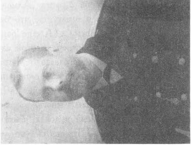
Штабс-капитан И.И. Конюшков, будущий генерал-майор, флагманский иштурман "Штандарта"