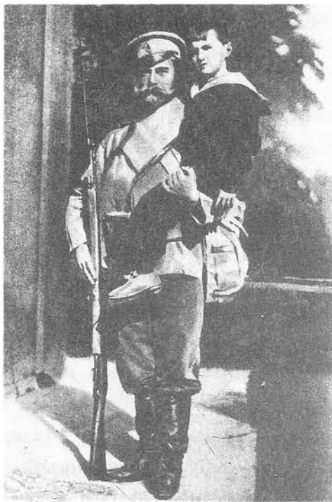
Император Николай II (с цесаревичем Алексеем) в полном солдатском снаряжении в Ливадии

Вскоре на Черном море начались осенние штормы, которые стали гнать в порт огромные волны, и они порядочно били “Штандарт” о мол, иногда рвали стальные тросы, хлестали через мол, снося с него в воду все имевшиеся на нем грузы. Однажды в такой шторм яхту оторвало от мола, но она удержалась на якоре. Пришлось вывести ее из порта за мол, в от-