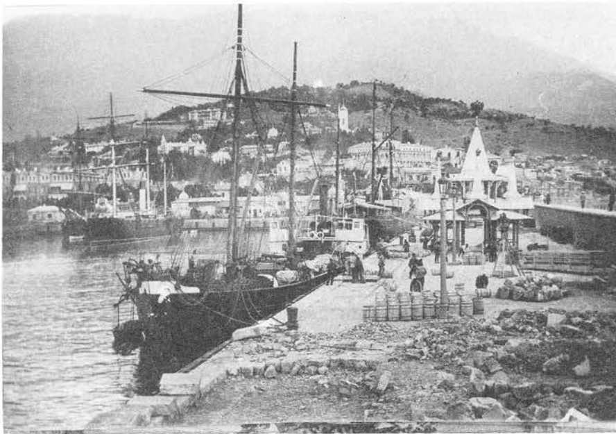
Общий вид Ялтинского порта

Экипаж “Штандарта” состоял из 370 матросов и офицеров. Помимо них, на судне находился большой оркестр