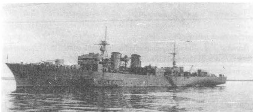
Гвардейский минный заградитель “Ока”, бывший “Марти”, бывшая яхта “Штандарт”