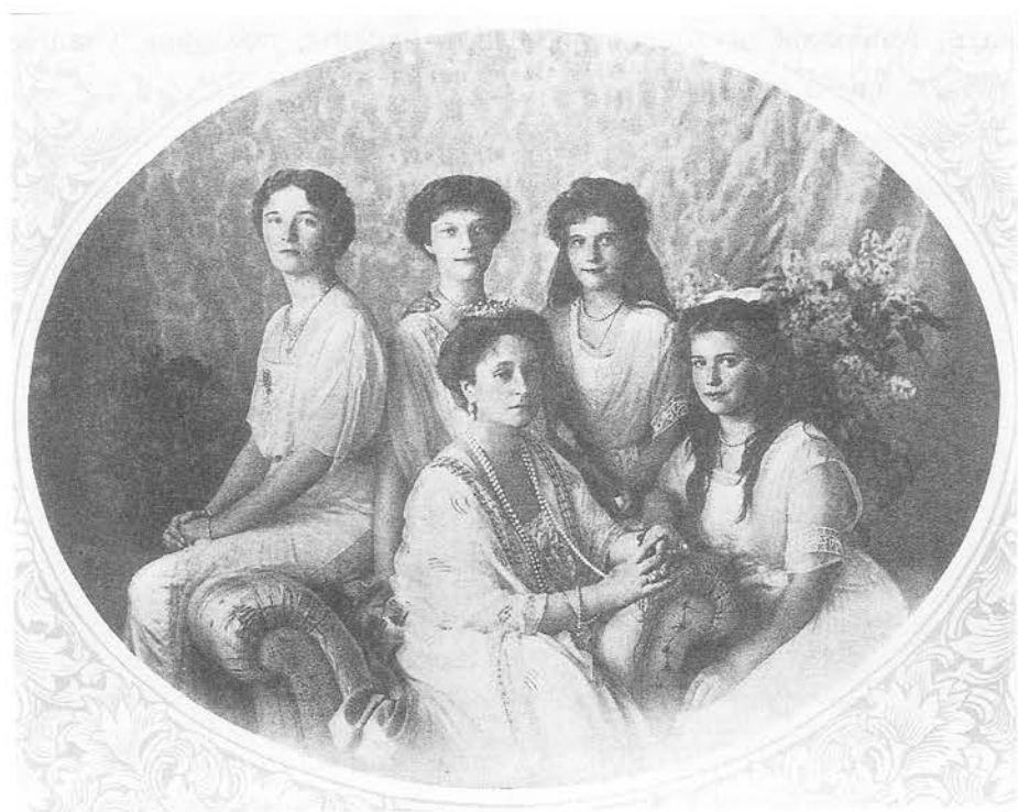
Императрица Александра Федоровна с дочерьми: Ольгой, Татьяной, Марией и Анастасией