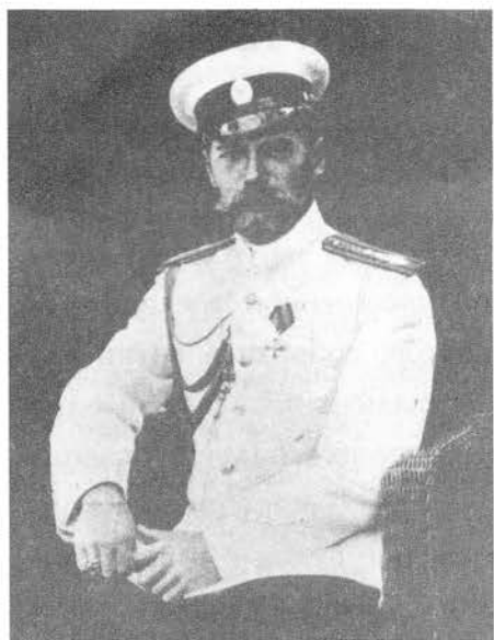
Император Николай II в морском кителе