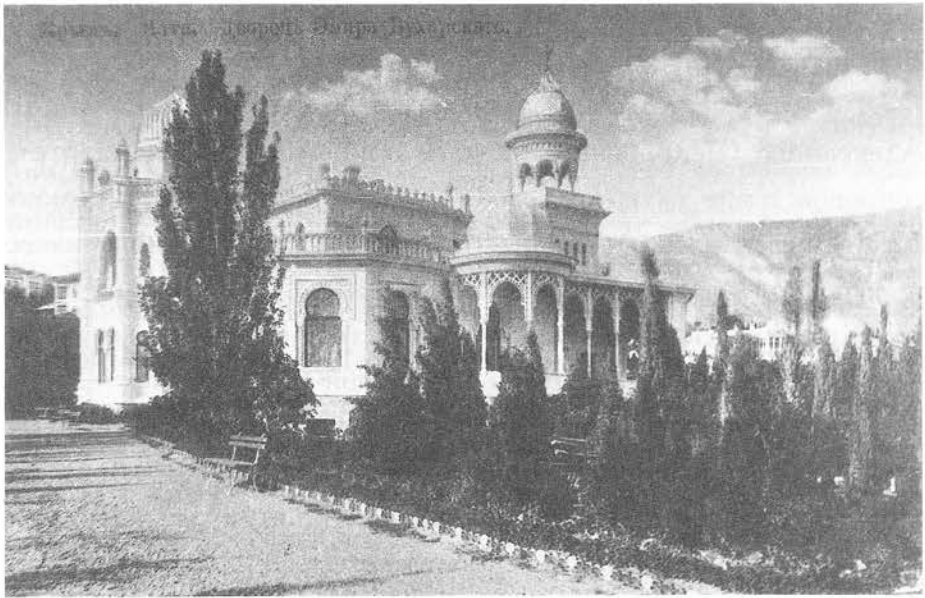
Дворец эмира Бухарского в Ялте

В ноябре Николай II принял на "Штандарте" делегацию от турецкого султана, затем на яхте отбыл в Одессу, на свидание с королем Италии. "Штандарт" сопровождали четыре миноносца.