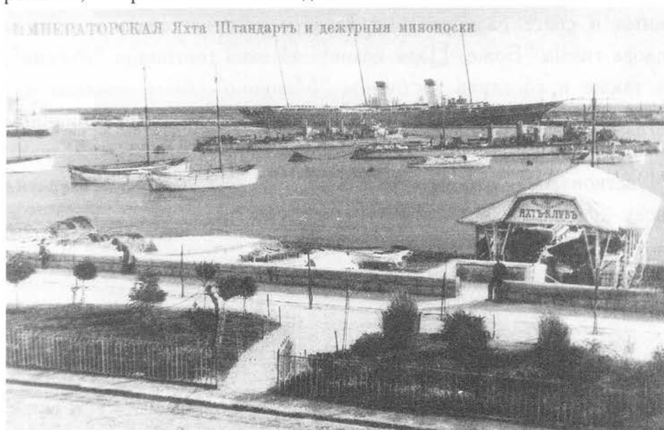
Императорская яхта "Штандарт" в порту под охраной двух миноносок — малых боевых кораблей, оснащенных торпедами

Более десятка экипажей, миновав празднично украшенную припортовую Бульварную улицу, не спеша покатали по Набережной, направляясь в Ливадию.